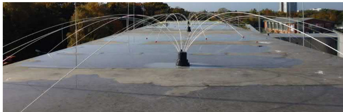
Möwenschreck – Spider Universal zum Schutz der Oberflächen von RLT-Anlagen