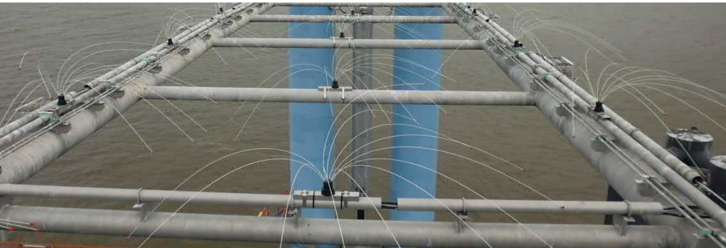
Dieselbe Rohrkonstruktion: möwenfrei durch Möwenschreck – Spider Universal