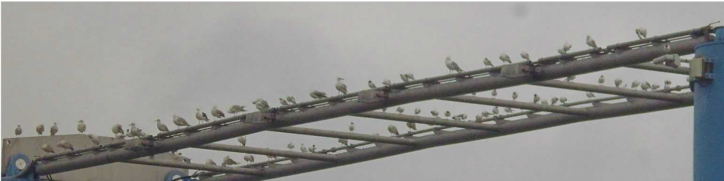
Ungeschützte Rohrkonstruktion vor der Montage des Möwenschreck – Spider Universal